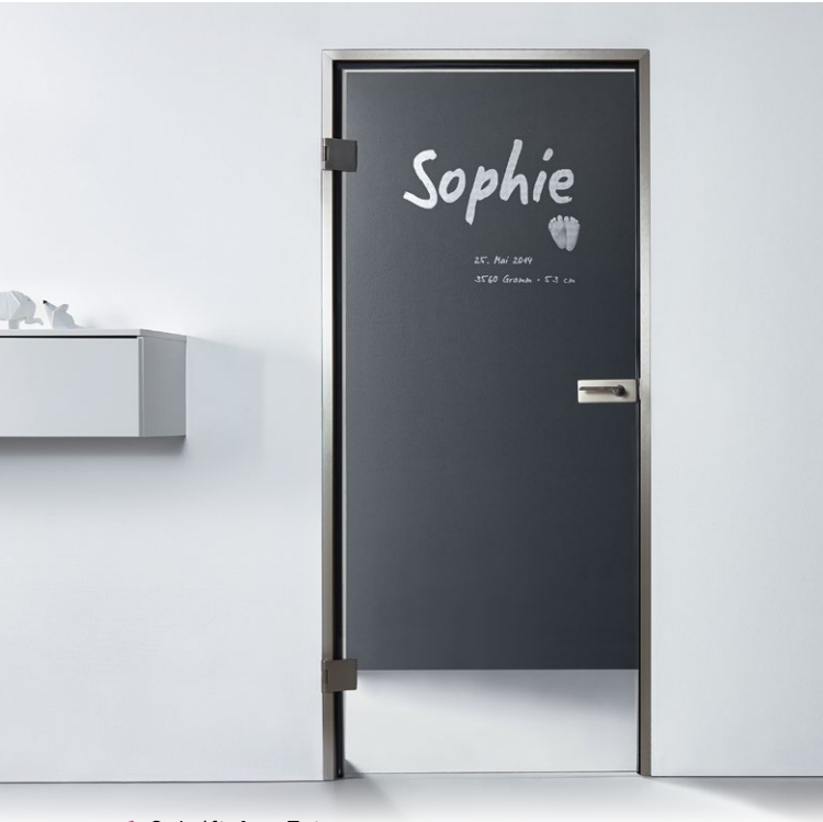
1 Schrift A + Foto