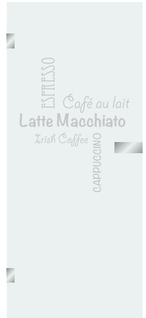
3 Schrift C + D + E