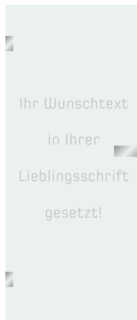
5 Schrift G