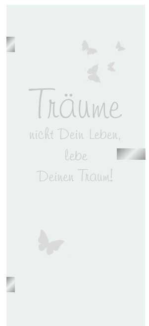
6 Schrift H + Illustration