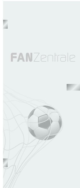
2 Schrift B + Illustration